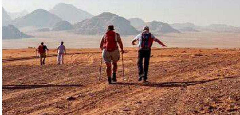
Sand und Wind haben in tausenden Jahren eine bizarre Landschaft geschaffen.

JORDANIEN Wenn Filmemacher fremde Planeten abbilden wollen, müssen sie sich etwas einfallen lassen – und landen dabei auch schonmal in der Wüste.