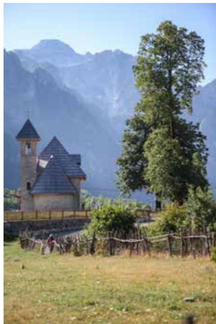
Kleinode finden sich in Albanien vor allem im Hinterland.