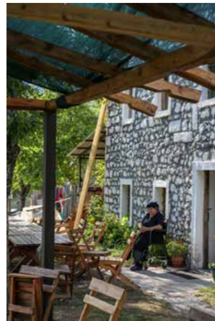
Das Leben scheint hier einen anderen Gang zu gehen als anderswo.