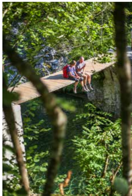
Rast an ungewöhnlicher Stelle und mit beeindruckender Aussicht.

„Kein anderer Ort, an dem Menschen leben, vermittelt solch einen Eindruck majestätischer Abgeschiedenheit vom Rest der Welt“, schreibt die britische Ethnologin und Balkanreisende Edith Durham Anfang des 20. Jahrhunderts über Theth. Eine Aussage, die heute noch gilt und die verschlafene Idylle kaum besser beschreibt. Über den Peja-Pass bedeutet „hinter dem Mond“: kaum Anzeichen menschlicher Zivilisation. Am Ende der Talflucht, entlang einer Felsenschlucht, durch die der wilde Shala fließt, versteckt sich das Dorf Nderlyaj. Darin ein fünfhundert Jahre alter Hof aus Stein, der vermutlich niemals einen Preis in Gemütlichkeit gewinnen wird, dafür punktet er mit Charme – und mit dem Stück Land, das ihn umgibt. Ein Erbstück. Drei Mal ausgebrannt, drei Mal wieder aufgebaut. Unbeugsam wie seine Bewohner: Familie