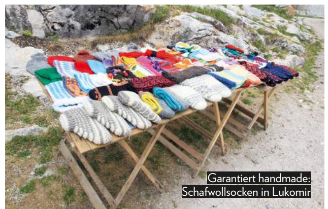
Garantiert handmade: Schafwollsocken in Lukomir