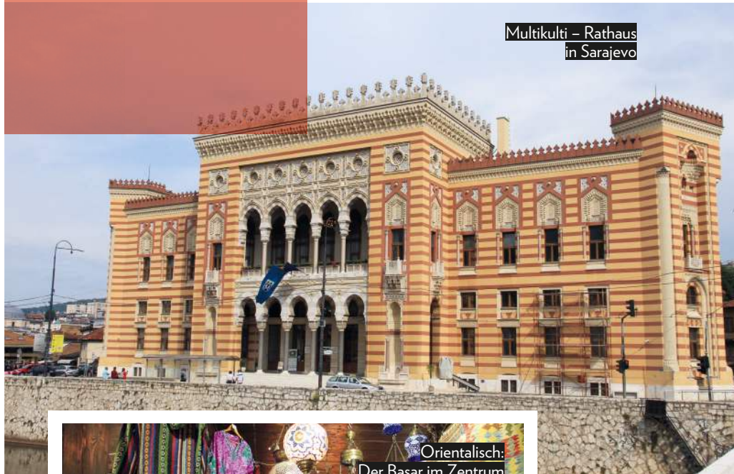
Multikulti – Rathaus in Sarajevo

„Bosnische Bergwelten“, eine neuntägige Wanderreise des österreichischen Veranstalters Weltweitwandern, ab € 1.590,- inklusive Anreise, Bus, Wanderführer:in und Vollpension, wird nach coronabedingter Pause im Jahr 2022 wieder regelmäßig durchgeführt (Termine: weltweitwandern.com/bag01 ).