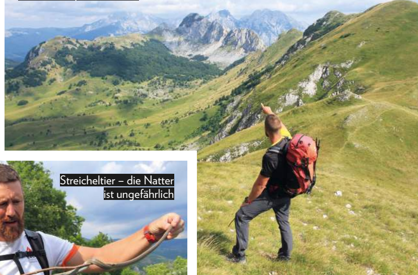
Streicheltier – die Natter ist ungefährlich