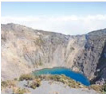
Farbenfrohe Hauptstadt San José (l. oben), Kratersee des 3400 Meter hohen Irazú (l. unten), Wanderung durch den nahe gelegenen Parque Prusia