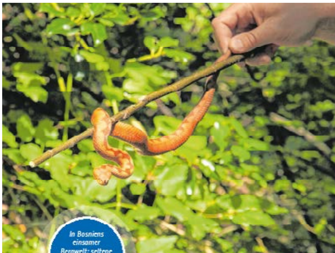
In Bosniens einsamer Bergwelt: seltene Hornottem und zaghafter Handel.