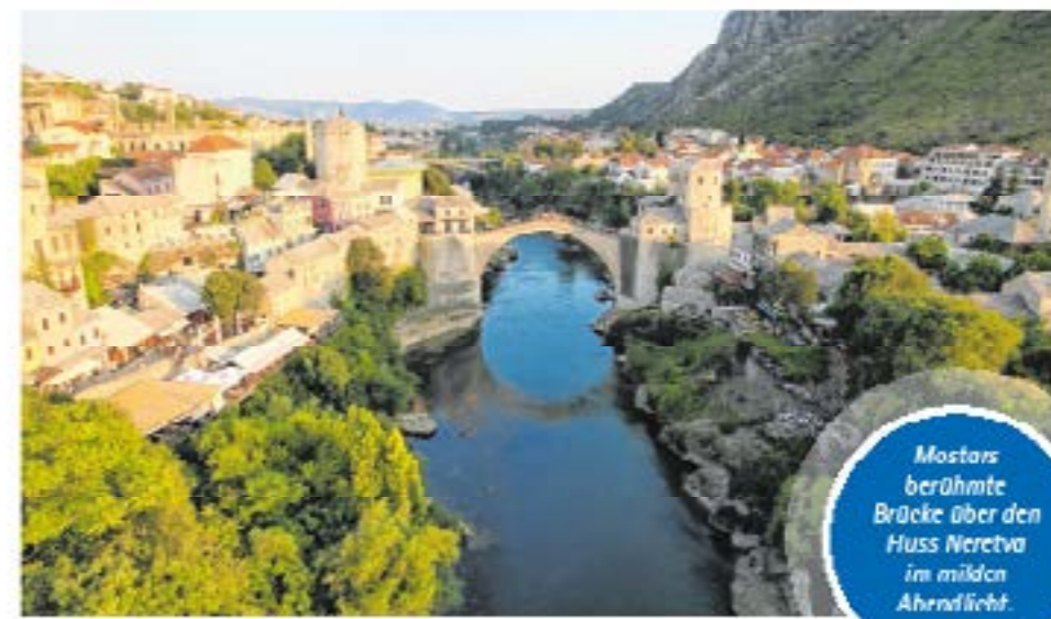
Mostars berühmte Brücke über den Fluss Neretva im milden Abendlicht.

nigen Travačko-See wartet ein vermittelter Holzschliff vor der Grenze zu Montenegro. Der Clebscherer selbst liegt schon im Nachbarland. Größer könnte der Kontrast kaum ausfallen: Nach der trüben Einsamkeit im Nationalpark drängen sich im liebervoll renovierten Altstadtkern Mostars Touristenherden auf der weltberühmten Brücke über die Neretva. Unter letztem „Uhhhh“ und „Ahhhh“ stürzt sich ein Brückenspringer die 26 Meter hinunter. In Kösse wird ein österreichischer Getränkhersteller hier seine Flügel testen und einen Wettbewerber aus Vau-Brücken Springen ausrichten. Wir entziehen dem Himmel. Vom hohen Minarett der Koski-Mehmed-Pascha-Moschee zeigt sich Mostar im Abendlicht von seiner schönsten Seite und die vielen Touristen schwärmen zu Anzeichen. ||